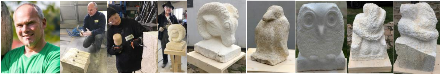
Rückblick Kurs Osterseminar 2019